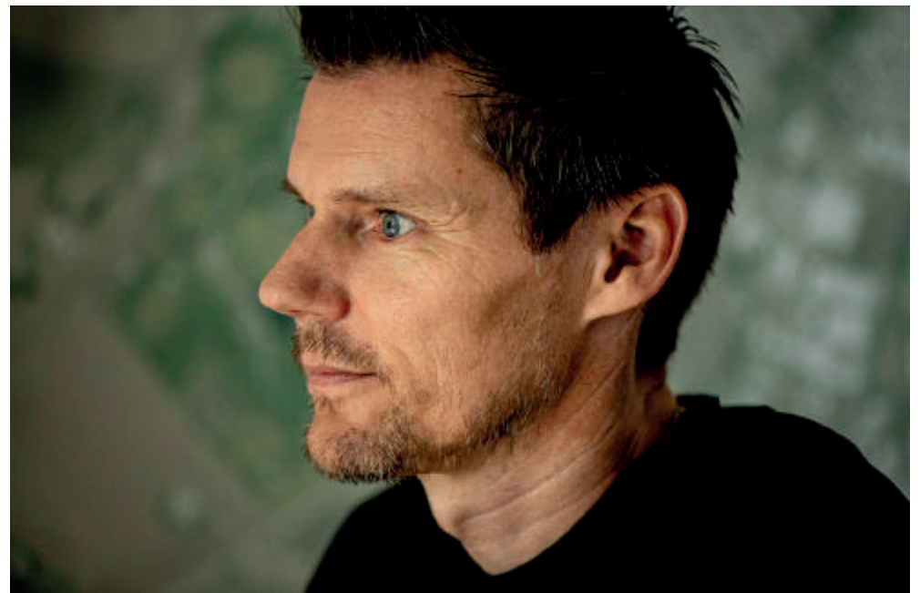
Han har endegyldigt sat et punktum for hele minkforløbet.