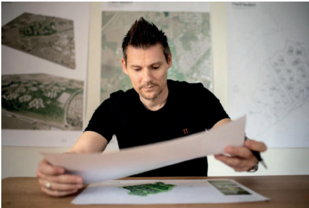
Byggeriet forventes at starte i foråret med første etape.