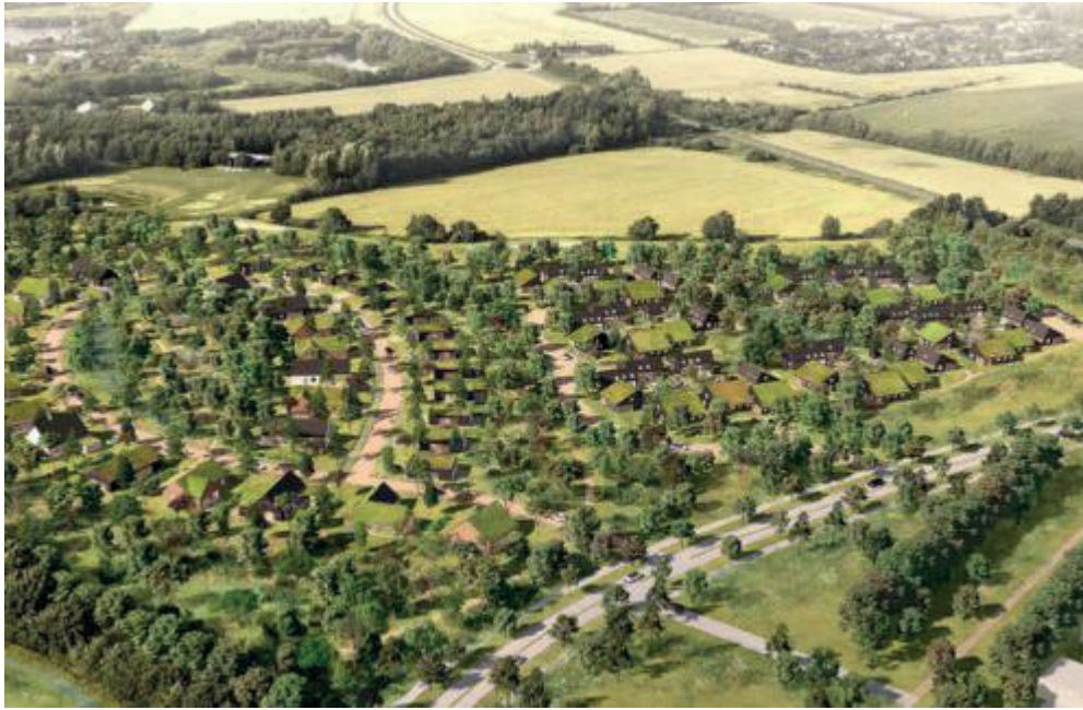
Den tidligere minkavler har udviklet naturbydelen i samarbejde med arkitekterne Rum og landskabsarkitekterne Labland. Illustration: Rum